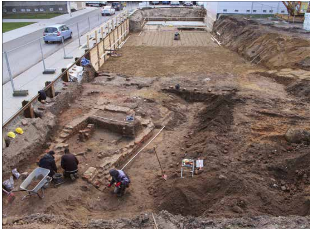
Abb. 4 Dessau-Flössergasse. Überblick über Fläche 1 im fortgeschrittenen Grabungsstadium mit Arbeiten in der nördlichen Fläche. Im Hintergrund laufende Bauarbeiten auf freigegebenen Flächen, links die heutige Flössergasse. Blick nach Süden.

kaufte dann anscheinend das Grundstück an der Breiten Straße.