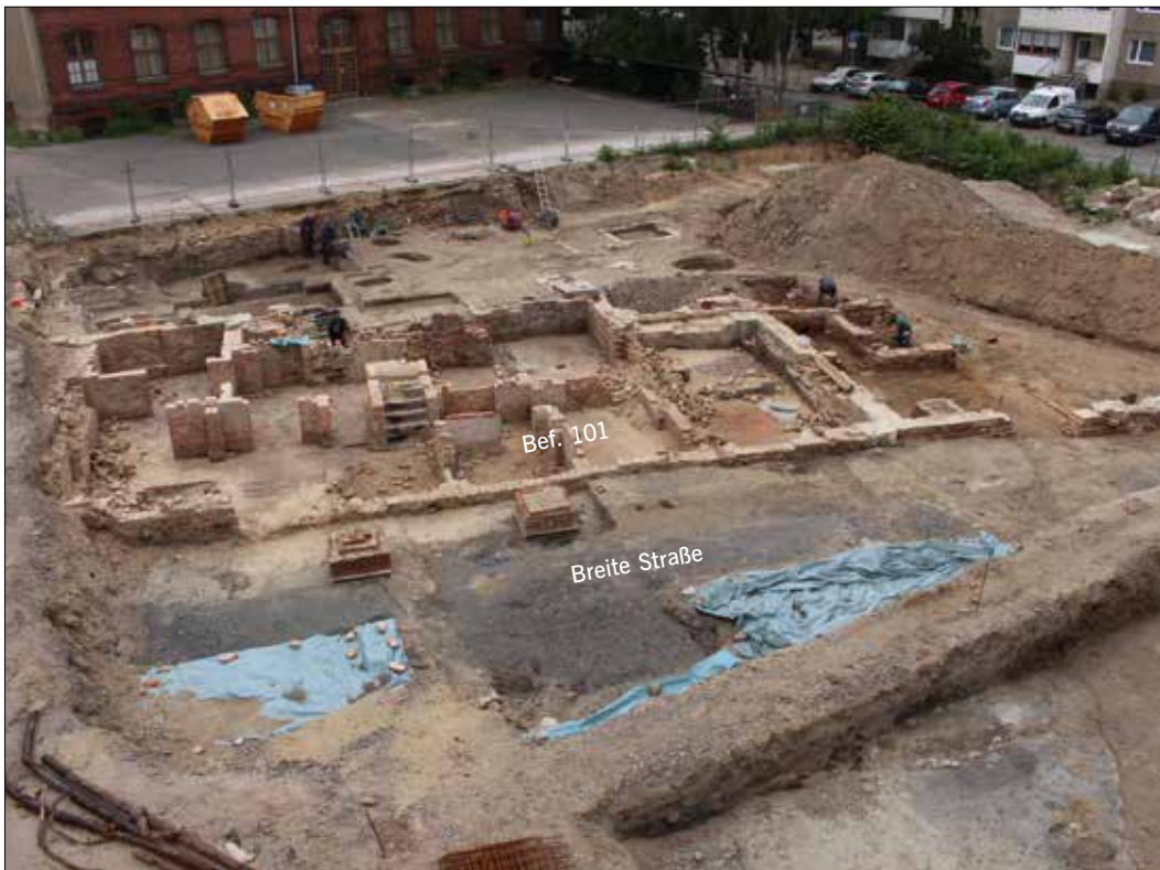
Abb. 5 Dessau-Flössergasse. Überblick über Fläche 2 im fortgeschrittenen Grabungsstadium. Im Vordergrund die ehemalige Breite Straße mit blauer Folie abgedeckten Knüppeldämmen, dahinter Keller Bef. 101, dahinter der Weststreifen. Im Hintergrund die alte Schule. Blick nach Nordwesten.

und rund 16.000 Funde inventarisiert. Bef. 10 war dabei für Streufunde reserviert.