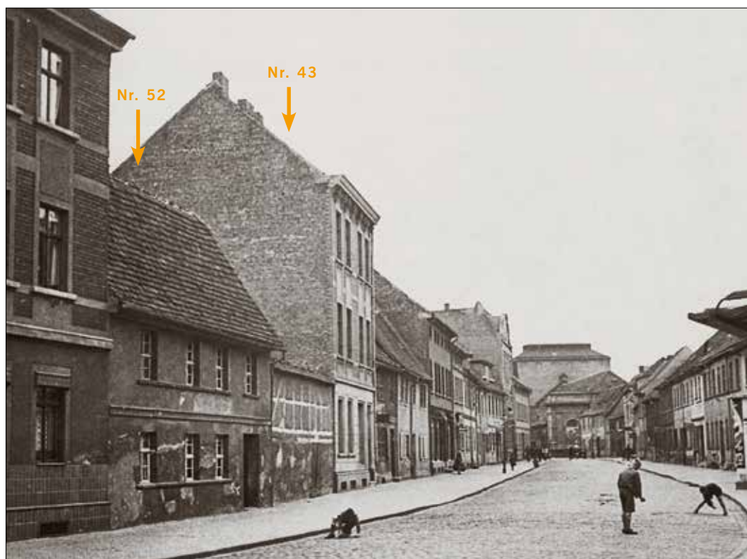
Abb. 3 Blick auf die östliche Seite der Breiten Straße, 1934. Das Haus mit den vier Fenstern im ersten Stock ist Nr. 52, das höhere Haus im Hintergrund ist Nr. 43. Blick nach Süden.

meterdicken Schlammschichten verfüllt war, die beim Bau des Bunkers entdeckt wurden.